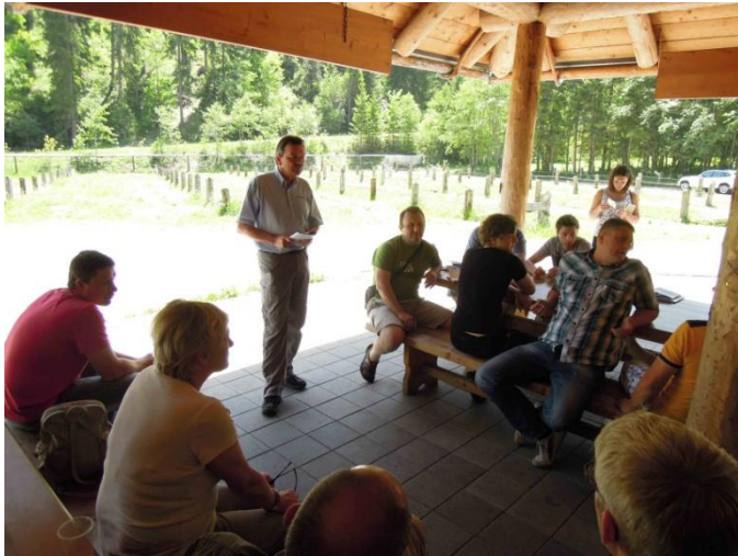
Pogovor z direktorjem parka Diemtigtal

Schweizerische Eidgenossenschaft Confédération suisse Confederazione Svizzera Confederaziun svizra