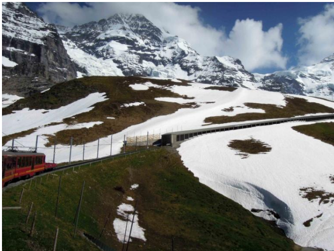
Proga zobate železnice na Jungfrauojch