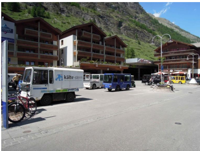
Parkirišče za e-vozila ob železniški postaji v Zermattu