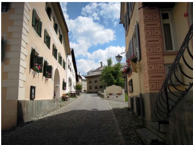
Turistična vas Guarda v Engadinu, ki je povezana z javnim transportom in pred katerim je urejeno parkirišče za obiskovalce