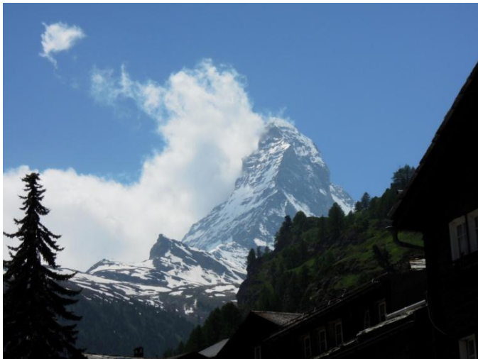
Pogled na Matterhorn iz Zermatta