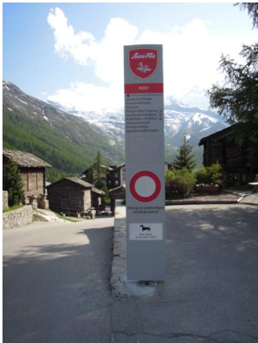
Prepoved prometa v Saas Fee