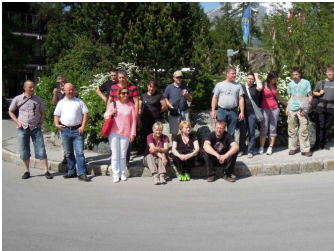
Udeleženci ekskurzije pri vstopni točki v Saas Fee

Schweizerische Eidgenossenschaft Confédération suisse Confederazione Svizzera Confederaziun svizra