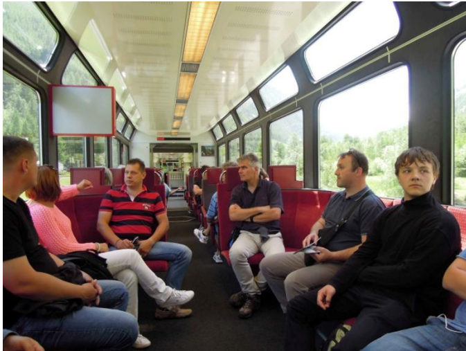
Železniška povezava med Täschom in Zermattom

Schweizerische Eidgenossenschaft Confédération suisse Confederazione Svizzera Confederaziun svizra